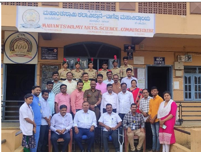
Group Photo with Blood Bank Team