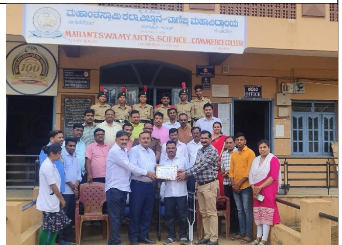
Appreciation Letter Received by Principle from Blood Bank Haveri