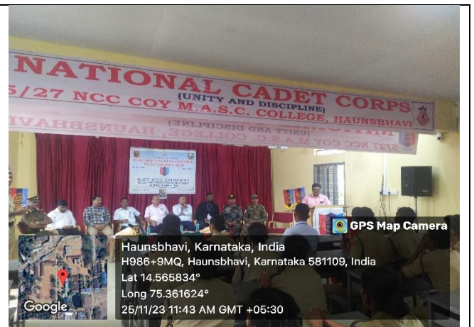
Vote of Thanks by: Shri. Venktesh P