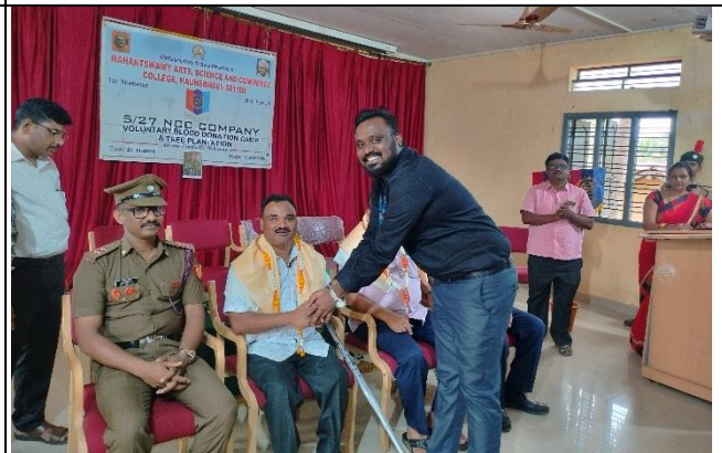
Felicitation to Chif Guest