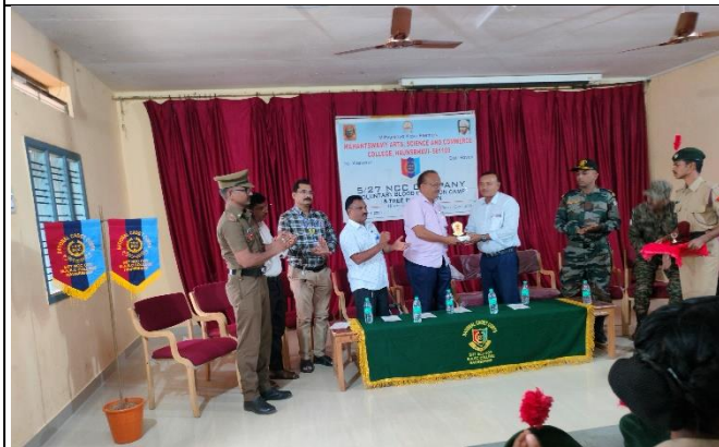
Presented momento to the Chief Guest